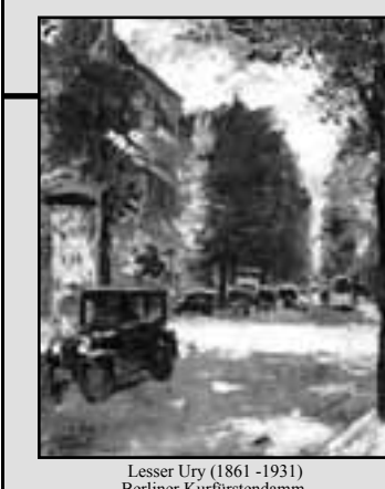
Lessaer Ury (1861-1931) Berliner Kurfürstendamm, Um 1925. Öl/Lwd., sign. 32 x 24 cm.

info@neumeister.com | www.neumeister.com | Kataloge auf Anfrage