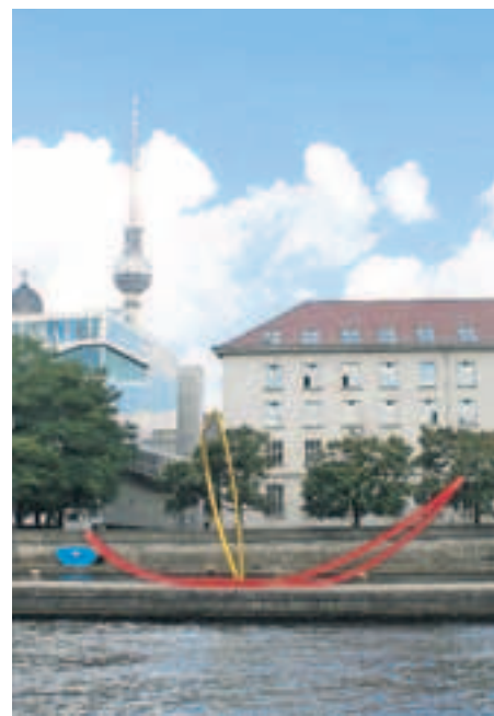
Schippernder Stahl. Habichers Skulptur „Gegen den Strom“ von 2010.

Habichers Skulpturen brauchen Raum und akzentuieren ihn zugleich. Vier Arbeiten hat er entlang der Wasserstraße installiert – den Anfang macht „Gegen den Strom“, das Ende markiert der U-Bahnzugang Spittelmarkt. Und obwohl ihr Material alltäglich ist, fallen die Arbeiten sofort auf. Ihre Farbgebung, meist Signalrot, macht sie zu artifiziellen Fremdkörpern. Berlins Denkmalschützer waren sie viel zu fremd für den historischen Stadtraum: Kurz vor der Fertigstellung seines Projekts untersagten sie die Installation der