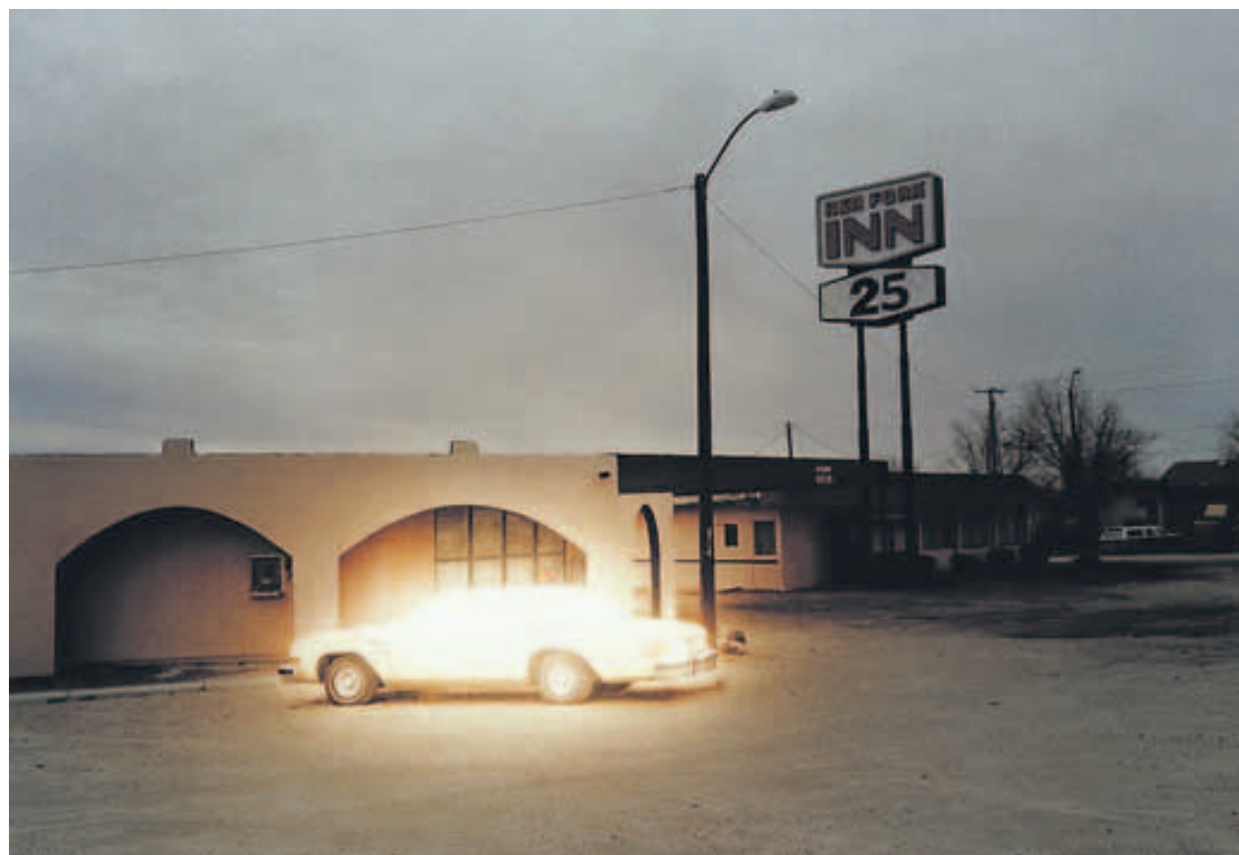
Leuchfeuer. Die Aufnahme „Car 2“ (2008), ein C-Print aus der Serie „The Great Unreal“.

— Galerie Cinzia Friedlaender, Potsdamer Str. 105; bis 4.9., Mi-Sa 13-18 Uhr.