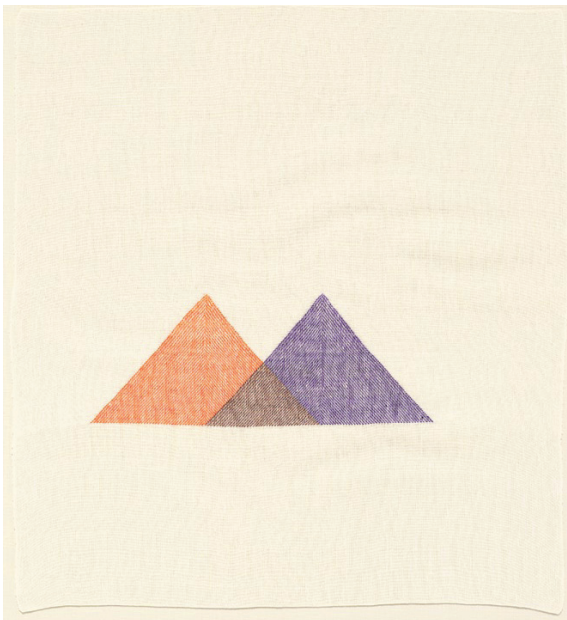
Ruth Laskey Twill Series (Deep Orange/Dark Brown/Purple), 2007 Handwoven linen 19,75 x 18,25 inches / 50,16 x 46,36 cm