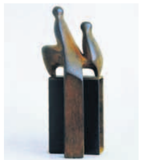
Rostiger Reiter. Plastik (Eisenguss, 2003) von Gertraude Zebe.

Zebes eiserne Zezo-Geschöpfe erwachen aus geometrischen Grundformen und animalischen bis anthropomorphen Strukturen, die in der Überscheidung zu ebenso konzentrierten wie kurio-