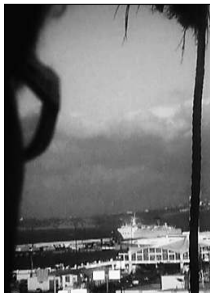
Bis 15. November, Di-Sa 12-18 Uhr, Potsdamer Str. 105