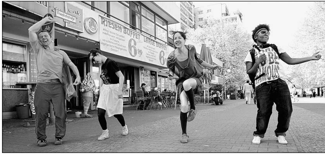
Gob Squad bei einer heiklen Mission: Welt retten

Das Schöne an der Welt ist doch, dass sich immer mal welche aufmachen, sie zu retten. Zu so einer Bruce-Willis-Mission hat sich nun auch das Künstlerkollektiv Gob Squad durchgerungen. „Saving the World“ verspricht es in seiner neuesten Produktion, und es geht dabei um die üblichen grundlegenden Dinge wie Liebe, Geld, Freiheit oder Tod, die von echtem Fachpersonal erläutert werden: nämlich ganz normalen Weltbürgern, die von Gob Squad am Mehringplatz eingefangen und filmisch festgehalten wurden. In einer Rundum-Projektion wird diese auf Videoframe eingedampfte Welt ab Donnerstag im HAU 2 präsentiert.