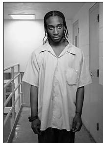
Bis 16. November, Di-Sa 10-19, Do 12-21 Uhr, Linienstr. 69