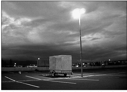
Mehr als 50 von KünstlerInnen betriebene Räume und Projekte stellen sich am Wochenende in der Akademie der Künste vor. Vom Wedding über Malzmö bis Reykjavik reicht das Netz, das die Internationale Gesellschaft der Bildenden Künste für „Art Swap Europe“ gesponnen hat. Neben einer Ausstellung gibt es Raum für Workshops und Gespräche. Samstag, 10 bis 20 Uhr, So 10.30 bis 14 Uhr, Hanseatenweg 10

Aedes Pfefferberg (# 2827015) Meschen in Deutschland. Fotografien. Di-Fr 11-19, Sa+So 13-17 bis 16.10. Christenst. 18/19 Akademie der Künste (# 200572000) Notation, Kalkül und Form in den Künsten. Di-So 11 bis 16.11. Hanseatenweg 10 Artnaud e. V. (# 28046650) Transcultural Paranoia. Gruppenausstellung. Di-Fr 11-19, Sa 11 bis 18 bis 31.10. Schumannstr. 6 artTransponder e. V. (# 30642400) Peace – Utopia or Real Space?. Weiterer Ausstellungsort: Projektraum Catalyst, Schlemmerstr. 34. Do 12-17, Fr+Sa 14-19 bis 2.11. Brunnenstr. 151 Berlinische Galerie (# 78902600) Berlin im Umbruch – Aus der Sammlung Kunst in Berlin. Neuorganisation der Sammlung. Mi-Wo 10 bis 18 bis 31.12. Alte Jakobstr. 124-128 daadigital e. V. (# 2613640) Shimbuku: Sea, Sky, Language and So On. Mi-Sa 11 bis 11.10. Zimmerstr. 90/91 Dune Berlin (# 7592302) Grit Hachmeister: Vom Himmel gelandet. Di-Sa 11 bis 18 bis 18.10. Invalidenstr. 90 Edition Block (# 32304069) Ich keine kein Weekend – Beuys & Block: die gemeinsamen Editionen 1966-1986. Di-Sa 11 bis 18 bis 11. Heidestr. 50 Galerie Davide Gallo (# 30607269) The Distance to the Sun. Videos. Di-Sa 14-19 bis Oktober. Lindenstr. 156 Galerie Gillian Martin (# 200297214) Magdalena von Rudy: Untold Stories. Di-Sa 13 bis 6.11. Brunnenstr. 3